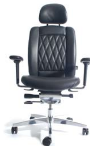
AluMedic® Limited „S“

AluMedic® Ltd. „S“ Aktionspreis ab € 1.499,- inkl. MwSt.